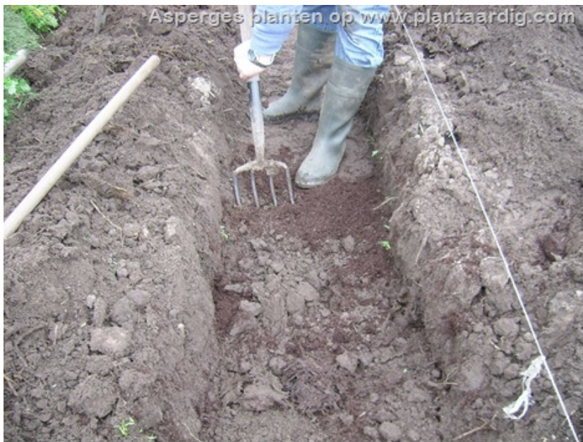
Foto : ook vlak voor het planten kan nog compost in de voor ingewerkt worden. Het is immers de enige kans om organische materiaal in de grond te werken.

Organische bemesting bij de aanleg van een aspergeteelt is aangewezen. Gebruik hiervoor stalmest of compost. Doe dit op het moment van de diepe grondbewerking. Gebruik zeker 10 liter compost of stalmest per m 2 . Na het diepspitten kan je nog een groenbemester telen. Zo is het uitgekozen stukje grond optimaal voorbereid op de planting van asperges het volgende voorjaar.